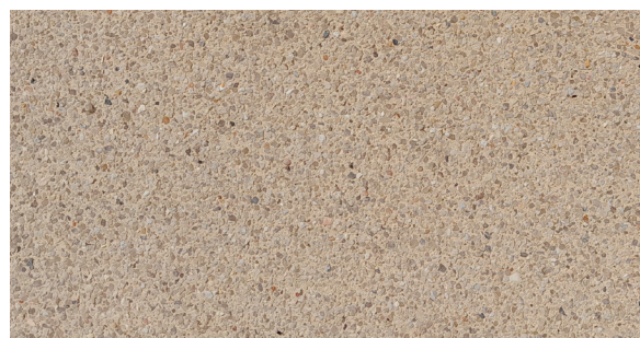
Detalhe do Sistema DECO SELECT M